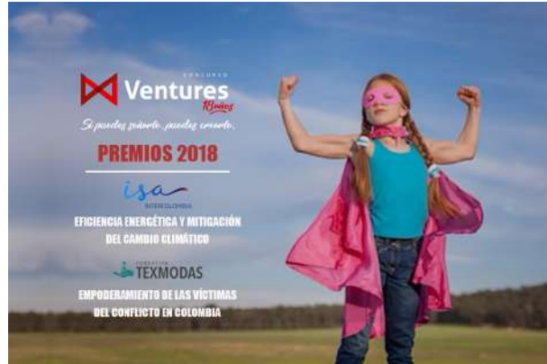
Charlas de convocatoria